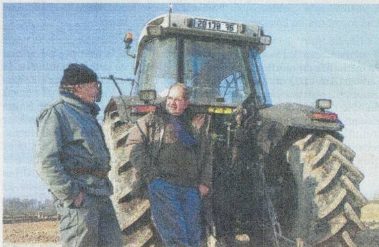
L'exploitant qui compte prendre sa retraite doit prévenir son proprié-

BOVINS VIANDE Les performances t Conseil bovin viande Cantal à la loup